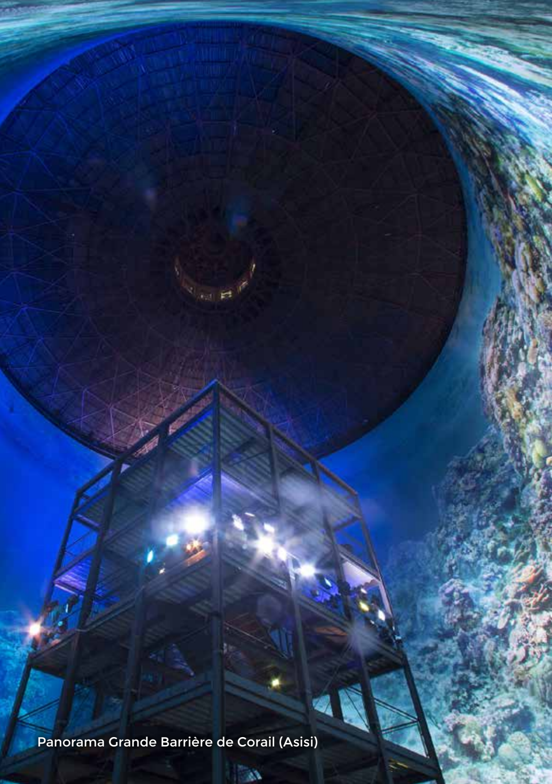
Panorama Grande Barrière de Corail (Asisi)